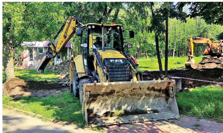
✓ Сейчас производят демонтаж всех твердых покрытий

Также в парке появится новая пешеходная зона от улицы Мичурина к улице Островского. Работы планируют завершить до 10 декабря.