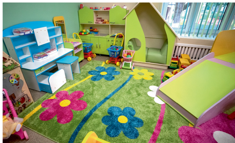
Островок детства» готов к открытию

Все школы стартовали в равных условиях. Мы впервые предоставили коллективу школ карт-бланш и в выборе архитектуры, и в выборе внутреннего дизайна. Везде результат оказался разным. И сейчас нужно, чтобы все увидели, у кого это лучше получилось. Где-то огонь, где-то нет огонь. Нужно дать профессионалам возможность проголосовать, что понравилось и что не понравилось, чтобы понять, как правильно вовлекать педагогический коллектив в вопросы капремонта. Всё это обсудим, чтобы сделать выводы перед тем, как будем формировать новую программу капремонта, — заключил губернатор.