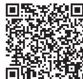
Подать заявку на участие в акции можно здесь

Заявки на участие в акции принимают до 3 ноября. Кроме того, организовать донорскую акцию, сдать кровь или создать новый контент на эту тему может любой желающий. Итоги акции подведут в декабре.