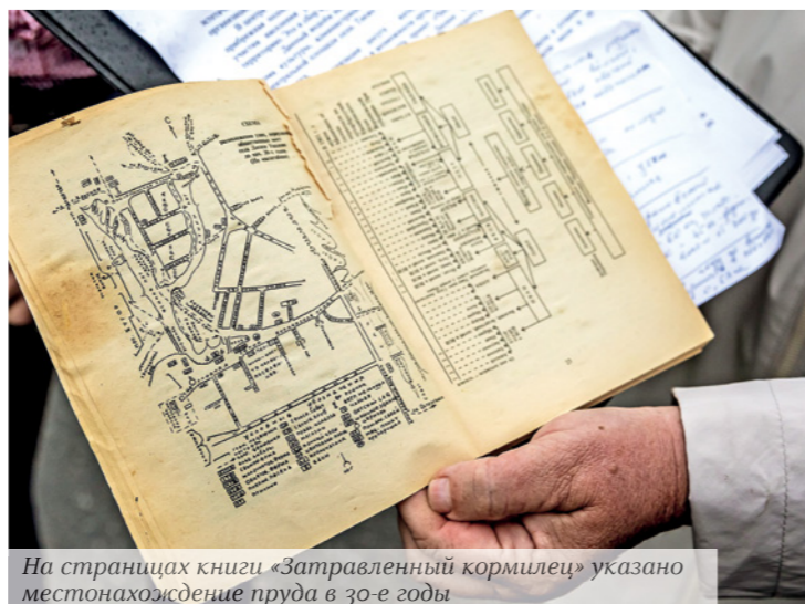
На страницах книги «Затравленный кормилец» указано местонахождение пруда в 30-е годы

— Купаться сюда в детстве ходили, соревновались и переплывали пруд. Рыбу ловили, она как будто и