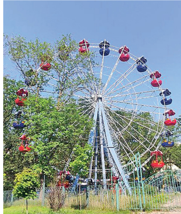
✓ Вопрос колеса обозрения остаётся открытым

В целом первый этап предполагает обустройство всех инженерных сетей, которые нужны парку, демонтаж старых сооружений, в том числе аттракционов, а также устройство фундаментов для новых зданий, которые должны быть построены в парке в 2024 году. Завершат работы до 1 декабря.