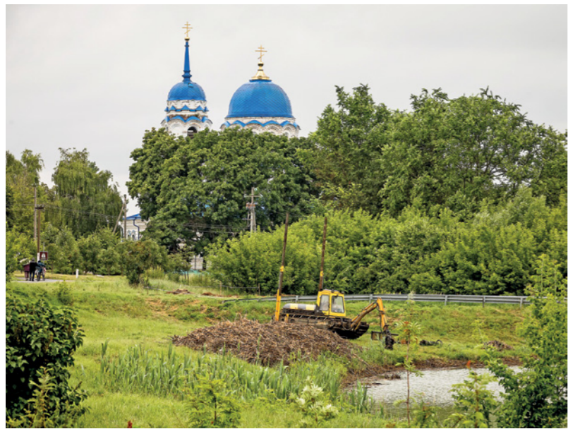
КОПАЛИ ПРУД СВОИМИ РУКАМИ, ЗАГОНЯЛИ ЛОШАДЕЙ, ВПРЯЖЁННЫХ В ТЕЛЕГУ, ЧТОБЫ ЗЕМЛЮ ВЫВЕЗТИ. ТАКЖЕ ЕГО И ЧИСТИЛИ.