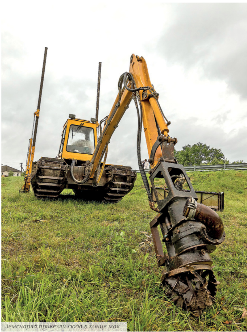
Земснаряд привели сюда в конце мая