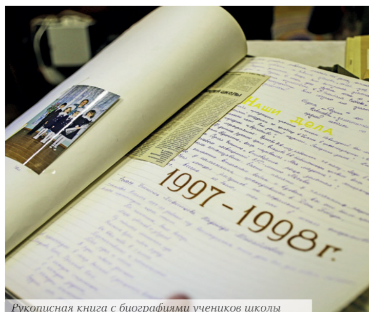
Рукописная книга с биографиями учеников школы