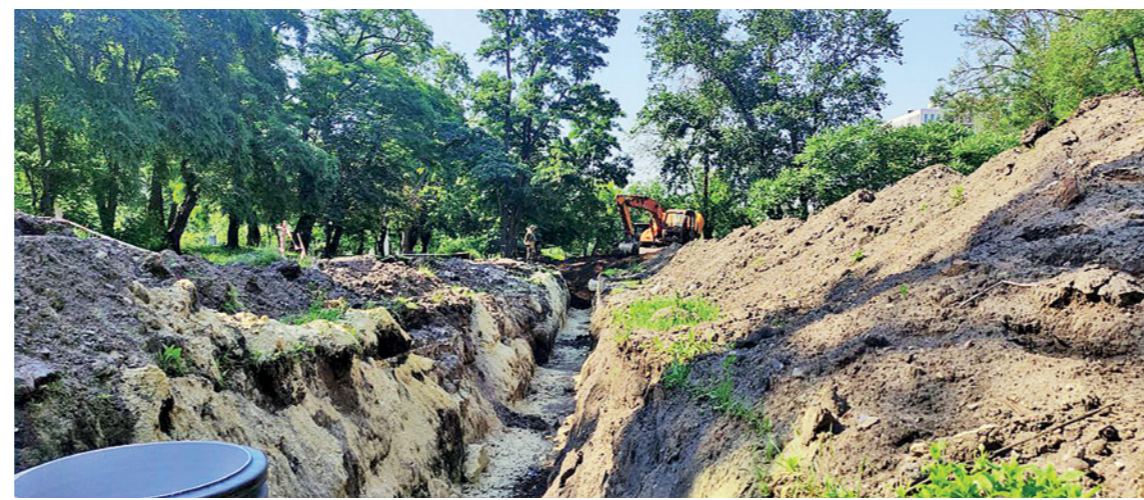
✓ Работы по прокладке сетей будут проводиться поэтапно

— Мы понимаем, что это должна быть площадка с лучшим видом, она станет точкой притяжения для горожан и гостей Белгорода. И город там должен оказаться как на ладони, — подчеркнул он.