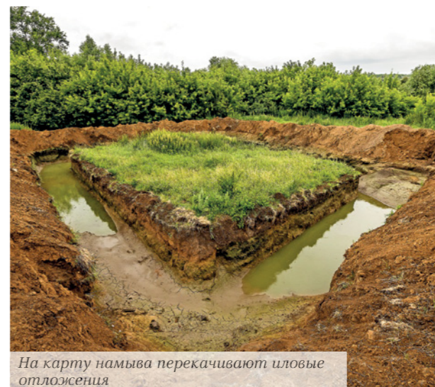
На карту намыва перекачивают иловые отложения

Тем не менее пруд пользуется популярностью у жителей села. По словам Дыбовой, на его берег приходят прогуляться, невдалеке детская площадка, которая привлекает родителей местных ребятишек.