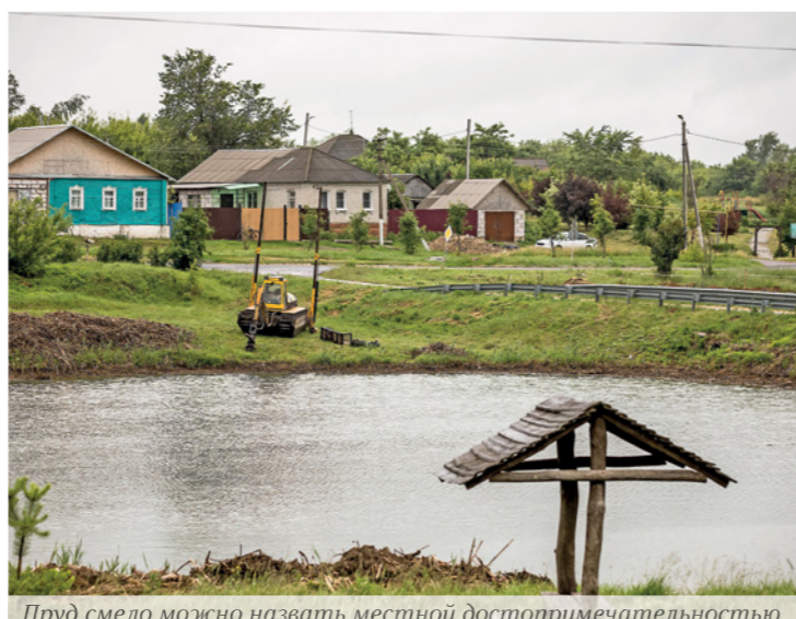
Земснаряд привели сюда в конце мая